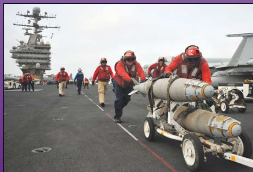
Armada yanqui carga bombas en USS Abraham Lincoln, que se está reubicando en apoyo a la guerra contra Afganistán, julio de 2008.

Poco antes de que Estados Unidos invadiera a Afganistán, Rumsfeld (entonces el secretario de Defensa) dijo que la mejor manera de atacar a las redes terroristas es "SECAR EL PANTANO" en que viven. El gobierno estadounidense tachó de "pantanos", o sea de blanco, a regiones enteras donde vivían cientos de millones de personas. Y ha emprendido una campaña para conquistar y reestructurar con violencia esas regiones y aplastar a quienquiera que se opusiera a su dominación o lo que se le bloqueara el camino.