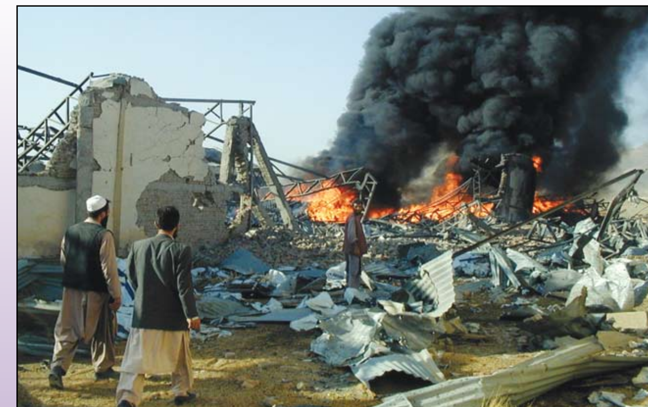
Se levantan nubes de humo negro después de ataques aéreos yanquis contra bodega de la Cruz Roja, Afganistán, octubre de 2001.

El Talibán es una fuerza reaccionaria. Desató horrores contra la población. Pero Estados Unidos no se le opone por eso, sino que se opone a la propagación del fundamentalismo islámico porque este constituye un obstáculo a su dominación del Medio Oriente. Y el imperialismo estadounidense está causando el mayor daño en el mundo y es la mayor amenaza para la humanidad.