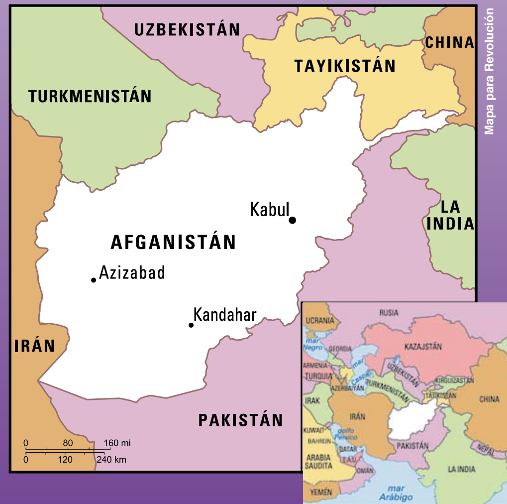
Mapa para Revolución

El Talibán es una fuerza reaccionaria. Desató horrores contra la población. Pero Estados Unidos no se le opone por eso, sino que se opone a la propagación del fundamentalismo islámico porque este constituye un obstáculo a su dominación del Medio Oriente. Y el imperialismo estadounidense está causando el mayor daño en el mundo y es la mayor amenaza para la humanidad.