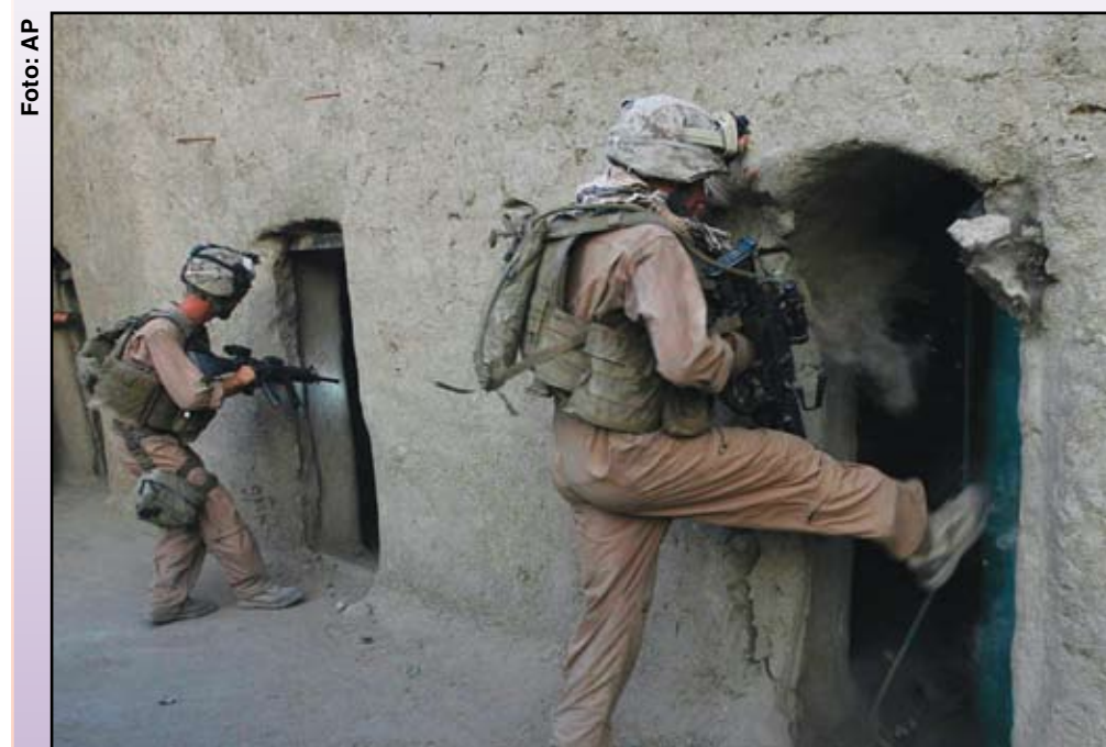
Marines yanquis tumban puertas de hogares, Garmser, Afganistán, julio de 2008.